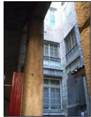
|12| 2 pl. du Gouvernement vers 10 quai Romain Rolland