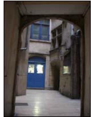
|11| 10 rue Saint-Jean vers 2 place du Petit Collège