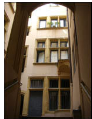
|13| 7 quai Romain-Rolland vers 7 rue Saint-Jean