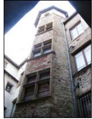
|10| 14 quai Romain Rolland vers 1 rue des Trois Maries