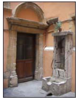
|9| 15 quai Romain Rolland vers 5 rue des Trois Maries